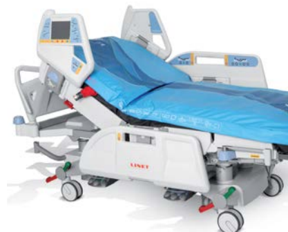
OptiCare met geïntegreerd design.